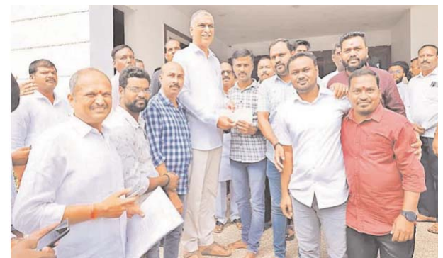
షాదీముబారక్, సీఎంఆర్ఎఫ్ లబ్ధిదారులకు చెక్కులు అందజేసే పరిస్థితి ఉండేది. కానీ కాంగ్రెస్ ప్రభుత్వం వచ్చాక నిర్బంధాలు, పోలీసు పహారాలో చెక్కులు పంచాల్సిన పరిస్థితి వచ్చింది. గురువారం విపంచి కళానిలయంలో జరిగిన కల్యాణలక్ష్మి చెక్కుల పం పిణీ కార్యక్రమం చూస్తే పరిస్థితి అలాగే కనబడింది. ఎన్నడూ లేనిది సిద్దిపేటలో ఎటుచూసినా పదుల సంఖ్యలో పోలీసులు కనబడుతున్నారని, గతంలో ఇలా ఎప్పు డూ జరగలేదని ప్రజలు మాట్లాడుకుంటున్నారు. బీఆర్ఎస్ నాయకులను, లబ్ధిదారుల కుటుంబసభ్యులను సైతం పోలీసులు లోనికి అనుమతించ లేదు. దీంతో కార్యక్రమం ముగిసే వరకు ప్రతిఒక్కరూ రోడ్డుపైనే నిలుచున్నారు.