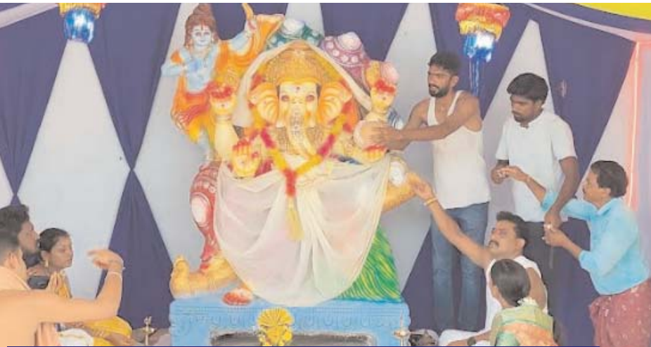
కాటారం మండలంలో ఘనంగా గణపతి నవరాత్రి ఉత్సవాలు