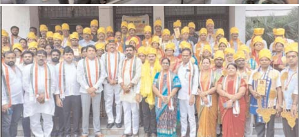
ఉపాధ్యాయులు తదితరులు పాల్గొన్నారు.