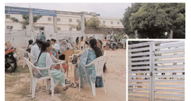
మాట్లాడించారు. బిల్లులు త్వరగా చెల్లిస్తామని హామీ ఇవ్వడంతో మధ్యాహ్నం 12 గంటల సమయంలో గేటు తెరిచారు. అప్పటి దా క విద్యార్థులు బోధనకు దూరమయ్యారు.

వనపర్తి-నవభూమి : జిల్లా కేం ద్రంలోని ప్రభుత్వ గురుకుల పాఠశాల, డిగ్రీ కళాశాలల అద్దె బకాయిలు చెల్లించలేదని భ వన యజమానులు సోమవారం ప్రధాన గేటుకు తాళం వేశారు. ఉపాధ్యాయులు, అ ధ్యాపకులను లోపలికి అనుమతించలేదు. నాగవరం వద్ద ఉన్న అనూస్ ప్రైవేట్ భవనం లో పెద్దమందడి సాంఘిక సంక్షేమ గురుకుల పాఠశాలలో 618 మంది, మహిళా డిగ్రీ కళాశాలలో 400 మందితో నిర్వహిస్తున్నారు. అ యితే, ఎనిమిది నెలలుగా బిల్డింగ్ కు అద్దె బ కాాయి ఉండడంతో యజమాని అగ్రహం వ్య క్రం చేశాడు. హాస్టల్ లో విద్యార్థులు ఉండగా గేటు బయట ప్రిన్సిపాళ్లు, అధ్యాపకులు, ఉ పాధ్యాయులు నిలిచిపోయారు. చాలాసేపటి తర్వాత అక్కడ పనిచేసే వర్కుస్ ఉపాధ్యాయులకు కర్చులు అందజేశారు. పాఠశాల భ వనానికి సంబంధించి నెలకు రూ.3 లక్షలు (8 నెలలకు రూ.24 లక్షలు), కళాశాల భవనానికి నెలకు రూ.4,50,601 (8 నెలలకు రూ.36,04,808) చొప్పున బకాయిలు చెల్లించకుంటే గేట్లు తాళం తీసేది లేదని తేల్చిచెప్పాడు. చివరకు ప్రిన్సిపాల్ జోక్యం చేసుకొని సంబంధిత అధికారులతో యజమానిని