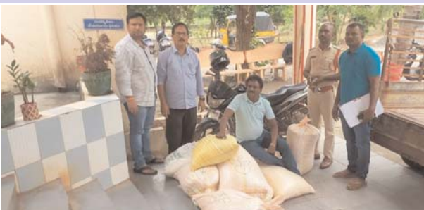
పై కేసు నమోదు చేసినట్లు ఎస్పీ తెలిపారు.