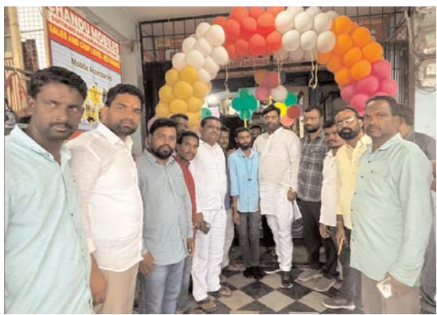
కార్యకర్తలు, పలువురు అభిమానులు తదితరులు పాల్గొన్నారు.