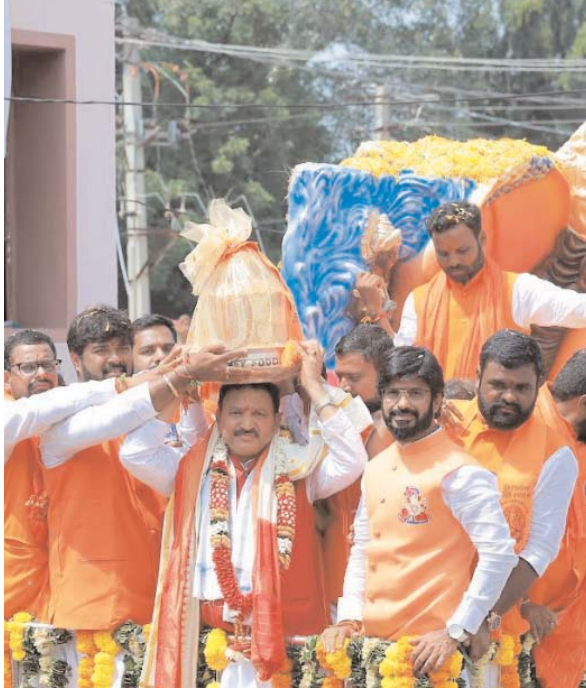
లడ్డూ లికార్డు స్థాయిలో ధర పలుకుతుంది

పూర్తి అయ్యింది గత 30 ఏళ్లుగా వేలం ఇలా 1994లో తొలిసారి బాలాపూర్లో లడ్డూ వేలం పాట ప్రారంభమైంది తొలిసారి వేలంలో లడ్డూ రూ. 450 పలికింది, 1995 లో రూ. 4500, 2002లో రూ. లక్ష 5వేలు, 2016లో రూ 14.65 లక్షలు, 2017 లో 15.60లక్షలు, 2018 లో రూ. 16.60లక్షలు, 2019లో రూ. 17.60లక్షలు, 2020లో కరోనా కారణంగా వేలం పాట రద్దు, 2021లో రూ. 18.90లక్షలు, 2022లో రూ. 24.60లక్షలు, 2023లో రూ. 27లక్షలు, 2024 లో రూ. 30లక్షల 1వేయి, దీంతో వేలల్లో ఉండే లడ్డూ ధర లక్షల్లో వెళ్ళింది నాటి నుంచి ప్రతి ఏడాది జరిగే వేలం పాటలో బాలాపూర్