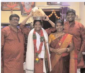
35 వేల రూపాయలకు కైవసం చేసుకున్నారు.