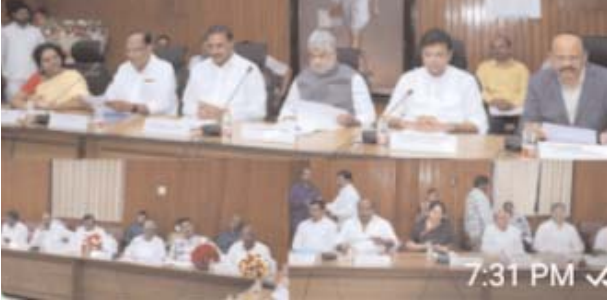
విధానాలు రూపొందించాలని ఆదేశం

హైదరాబాద్, సెప్టెంబర్ 21, నవభూమి ప్రతినీధి- రాష్ట్రంలో ఐటీఐలను అడ్వాన్స్ టెక్నాలజీ సెంటర్స్ గా మారుస్తున్న నేపథ్యంలో సిబ్బంది కొరత లేకుండా చూడాలని సూచించిన సీఎం. ప్రస్తుత ఇండస్ట్రీ అవసరాలకు అనుగుణంగా సిలబస్ ను అప్ గ్రేడ్ చేయాలన్న సీఎం. సిలబస్ మార్పుకు కమిటీని నియమించి నిపుణుల సలహాలు, సూచనలు స్వీకరించాలని ఆదేశం. అవసరమైతే స్కీల్ యూనివర్సిటీ సహకారం తీసుకోవాలన్న సీఎం. పాలిటెక్నిక్ కళాశాలల్లో కొత్త ఏటీసీలను ఏర్పాటు చేసే అంశాన్ని పరిశీలించాలన్న సీఎం. ఐటీఐలు లేని అసెంబ్లీ నియోజకవర్గాలను గుర్తించి రిపోర్ట్ సమర్పించాలని అధికారులకు ఆదేశం. 100 నియోజకవర్గాల్లో ఐటీఐ/ఏటీసీలు ఉండేలా చర్యలు చేపట్టాలని ఆదేశం. వృత్తి నైపుణ్యం అందించే ఐటీఐ/ఏటీసీ, పాలిటెక్నిక్ కళాశాలలను స్కీల్ యూనివర్సిటీ పరిధిలోకి తెచ్చేలా విధానాలు రూపొందించాలని ఆదేశం