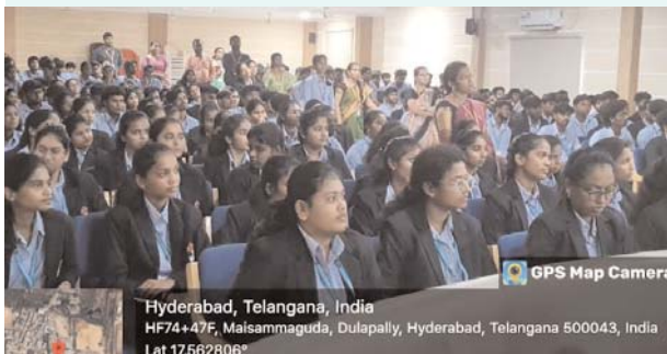
Hyderabad, Telangana, India HF74+47F, Maisammaguda, Dulapally, Hyderabad, Telangana 500043, India Lat 17.562806°