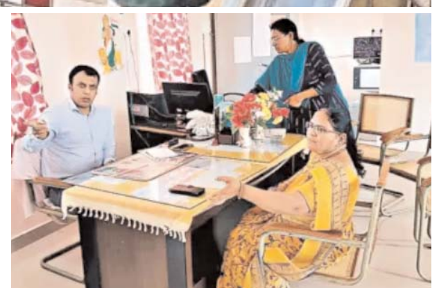
వీరంతా వారికి కేటాయించిన వాటిని సందర్శిస్తున్నారు.