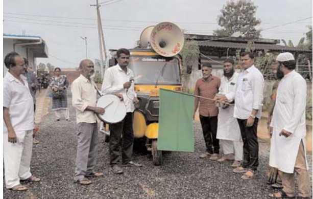
ఊపి సహాయ కార్యక్రమ వాహనాన్ని ప్రారంభించారు.