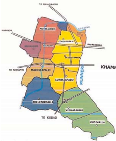
DRAFT MAP OF EDULAPURAM MUNICIPALITY KHAMMAM DISTRICT-TELANGANA STATE