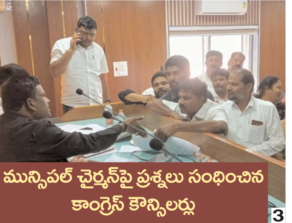
మున్సిపల్ చైర్మన్ పై ప్రశ్నలు సంధించిన కాంగ్రెస్ కాన్సిలర్లు