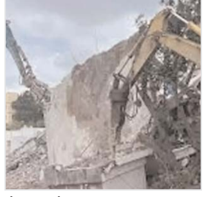
నేలమట్టం చేయగా.. వంద ఎకరాలకు పైగా విలువైన భూములను ప్రభుత్వానికి స్వాధీనం చేసింది. ఈ నెల మొదటి వారంలో హైద్రా ఇచ్చిన నివేదిక ప్రకారం 23 ప్రాంతాల్లో 262 అనధికారిక కట్టడాలను కూల్చివేసినట్లు పేర్కొన్నారు. మొత్తం 111.72 ఎకరాల భూమిని స్వాధీనం చేసుకున్నట్లు వెల్లడించారు.

హైదరాబాద్-సహాయవిభాగం: చుట్టూ పక్కల ఏరియాల్లో ఇప్పుడు ఎవరినోట విన్నా హైద్రా మాటనే వినిపిస్తోంది. ఏ ఇద్దరు కలుసుకున్నా హైద్రా గురించే చర్చిస్తున్నారు. ఎవరికీ లొంగకుండా దూసుకెళ్తున్న బుల్డోజర్లు, నేలమట్టం అవుతున్న కట్టడాలపై అంతటా చర్చ నడుస్తోంది. ముఖ్యమంత్రి రేవంత్ రెడ్డి ఆలోచనల నుంచి ఏర్పాటుైన హైద్రా..