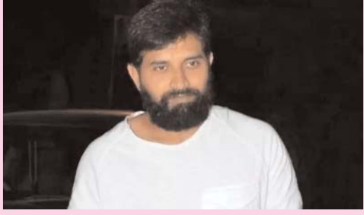
లేడి డ్యూప్లికేషన్ లైంగికంగా వేధించాడంటూ ఆరోపణలతో పాటు పోక్సో కేసులో అరెస్టయిన టాలీవుడ్ కొరియోగ్రాఫర్