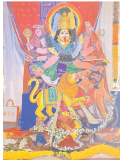
రాజరాజేశ్వరి దేవి అలంకారం చేసి ప్రత్యేక పూజలు నిర్వహించి, దసరా వేడుకలను ఘనంగా నిర్వహించ నున్నట్లు తెలిపారు. భక్తులు ఈ