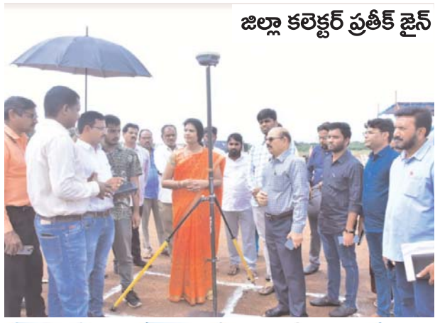
జిల్లా కలెక్టర్ ప్రతీక్ జైన్