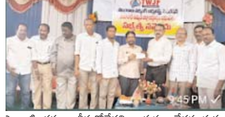
ఎలాంటి చర్యలు తీసుకోలేదని ఆయన ఆవేదన వ్యక్తం చేశారు. జర్నలిస్టుల ఇళ్ల ప్లలాలు, హెల్త్ కార్డులు, అక్రిడిటేషన్ కార్డులు, పెన్షన్ స్కీం వంటి సమస్యలను వెంటనే పరిష్కరించాలని, లేనిపక్షంలో ఫెడరేషన్ పోరాటం తప్పదని ఆయన హెచ్చరించారు. రాష్ట్రంలో ఉన్న ఇతర జర్నలిస్టు సంఘాలకు ప్రత్యామ్నాయం తెలంగాణ వర్కింగ్ జర్నలిస్ట్స్ ఫెడరేషన్ అని, జర్నలిస్టుల సమస్యలపై పోరాడే ఏకైక సంఘం ఇదేనని అన్నారు. కొన్ని జర్నలిస్టు సంఘాలు ప్రభుత్వంలో పదవులు పొంది పాలకులకు తలోగ్గుతూ జర్నలిస్టుల సమస్యలను విస్మరిస్తున్నాయని, పదవులు, పైరవీల కోసం

యునియన్ టీడబ్ల్యుజేఎఫ్ అని అన్నారు. ప్రజలకు ప్రభుత్వానికి మధ్య వారధిగా ఉంటూనే, జనం సమస్యల పరిష్కారానికి ప్రజాస్వామ్యంలో ప్రధాన భూమిక పోషిస్తున్న జర్నలిస్టులు తమ హక్కుల కోసం సంఘటితంగా ఉండాలని అన్నారు. నిరంతర అధ్యయనం, ప్రజా సమస్యలపై కథనాలు అందిస్తూ సమాజంలో తమకంటూ స్థానం పొందాలని ఆయన సూచించారు. రాష్ట్రంలో జర్నలిస్టుల సమస్యలు పదేళ్లుగా ఎక్కడ వేసిన గొంగళి అక్కడే అన్నట్లుగా ఉన్నాయని, గత ప్రభుత్వాలు సమస్యలను పరిష్కరించకుండా నిర్లక్ష్యం చేశాయని అన్నారు. జర్నలిస్టుల సమస్యలను ఇప్పటికే కొత్త ప్రభుత్వానికి విన్నవించామని, ప్రభుత్వం ఏర్పడి పది మాసాలు గడిచినా ఇంత వరకు పరిష్కారం కోసం