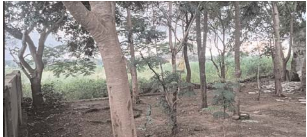
ఆరోపిస్తున్నారని పిల్లల భవిష్యత్తు దృష్టిలో ఉంచుకొని వెంటనే ప్రవారీ గోడ నిర్మాణానికి చర్యలు తీసుకోవాలని శాసనసభ స్పీకర్ గడ్డం ప్రసాద్ కుమార్ ను దుర్గం చెరువు గ్రామస్తులు కోరుతున్నారు

మోమిన్ పేట అక్టోబర్ 23 నవభూమి ప్రతినిధి- మోమిన్ పేట మండలంలోని దుర్గం చెరువు ప్రాథమికోన్నత పాఠశాల కు ఉన్న ప్రవారీ గోడ కూలిపోయి సంవత్సరాలు గడుస్తున్నా ఇప్పటివరకు పట్టించుకునే నాధుడే కరువయ్యాడని స్థానికులు ఆరోపిస్తున్నారు చిన్నపిల్లలు పాఠశాలకు వెళ్లాలంటే పాములు క్రింది కీటకాలు తేలు వంటివి వస్తున్నాయని ఉపాధ్యాయులు సైతం భయాందోళనలో గురి అవుతున్నారని గత ప్రభుత్వంలో పాఠశాల ప్రవారీ కూడా నిర్మాణానికి ప్రతిపాదన తయారు చేసిన ఇప్పటివరకు మంజూరు కాలేదు ఇప్పటికైనా స్థానిక శాసనసభ్యులు శాసనసభ స్పీకర్ గడ్డం ప్రసాద్ కుమార్ ప్రత్యేక చొరవ తీసుకొని విద్యాలయాళపై దృష్టి సారించి ప్రభుత్వ పాఠశాలలో చొరవ వసతులు కల్పనకై కృషి చేయాల్సిన అవసరం ఎంతైనా ఉందని స్థానికులు ఆరోపిస్తున్నారు గతంలో పనిచేసిన సర్పంచులు ఎంపీటీసీలు పట్టించుకోకపోవడం వల్లే ఇలాంటి దుస్థితి ఏర్పడిందని వారు