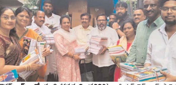
హైదరాబాద్, అక్టోబరు 3 (నవభూమి ప్రతినిధి): ఇండియన్ రెడ్ క్రాస్ సొసైటీ హైదరాబాద్ జిల్లా శాఖ కు వరద బాధితుల పిల్లల కోసం పాఠశాలల మరియు కళాశాలల యాజమాన్యం పుస్తకాలు మరియు స్టేషనరీ జిల్లా కార్యాలయానికి అందజేత: ఇండియన్ రెడ్ క్రాస్ సొసైటీ, హైదరాబాద్ జిల్లా శాఖా చైర్మన్