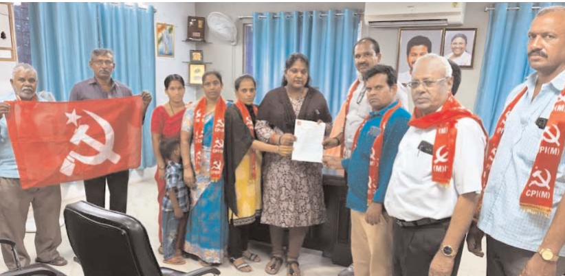
కుత్బుల్లాపూర్ అక్టోబర్ 3: (నవభూమి ప్రతినిధి) సి,పి,ఎం సూరారం డివిజన్ కమిటీ ఆధ్వర్యంలో గాజులరామారం సర్కిల్ డీకే ని కలిసి వినతి పత్రం ఇవ్వడం జరిగింది ఈ కార్యక్రమంలో పాల్గొన్న సిపిఎం పార్టీ మండల