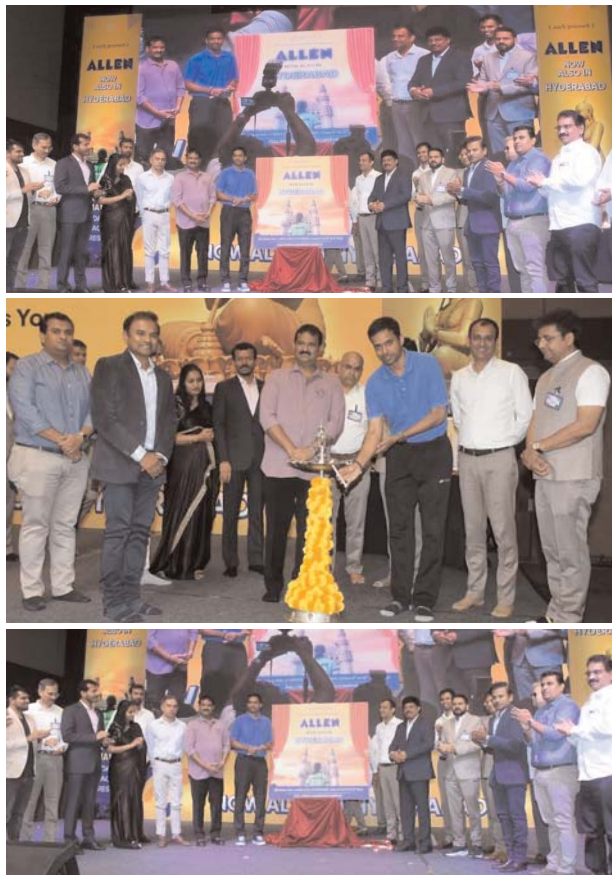
ఆదర్శప్రాయమైన ఫలితాలను కనబరిచారు. ఈ సంవత్సరం, జెఈఈ అడ్వాన్స్డ్ 2024లో 635 మంది విద్యార్థులు జెఈఈ అడ్వాన్స్డ్ లో అర్హత సాధించడంతో పాటుగా మా విద్యార్థులలో ఐదుగురు టాప్ 100లో చేరారు. నీట్ 2024లో 17 మంది విద్యార్థులు 700 కంటే ఎక్కువ స్కోర్లు సాధించగా, ఈ షోటీ పరీక్షలో 599 మంది విద్యార్థులు 600 కంటే ఎక్కువ స్కోర్ చేయడంతో దక్షిణాదిలోని మా క్యాంపస్ ల విద్యార్థులు వైస్సె రంగంలో అద్భుతమైన విజయ గాధలను కూడా రాశారు. అలెన్ ఫలితాలన్నీ ప్రపంచ-ప్రసిద్ధ ఆడిటర్ ఎర్నెస్ట్ & యంగ్ చేత ధృవీకరించబడ్డాయి, అలా ధృవీకరణ పొందిన మొదటి విద్యా సంస్థగా మేము గుర్తింపు