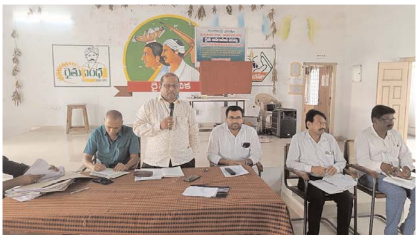
ఉందని అన్నారు. తేమ 17శాతం లోపు, తాలు 1 శాతం, తయారు కానీ ధాన్యం 3 శాతం, రంగుమారిన, పగిలిన ధాన్యం 5 శాతం లోపు ఉండాలని తెలిపారు. సమావేశంలో ఎంపిడిఓ