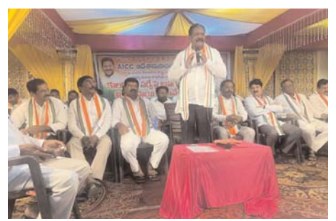
జిల్లాలోని అన్ని మండలాల నుంచి విచ్చేసిన ముఖ్య నాయకులు కార్యకర్తలు హాజరయ్యారు.