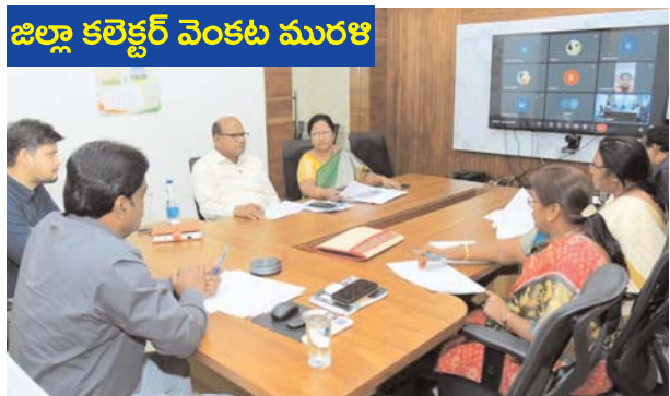
జిల్లా కలెక్టర్ వెంకట మురళి

నవభూమి - బాపట్ల : అర్బుల్లైన ప్రతి ఒక్కరికి ప్రభుత్వ సంక్షేమ పథకాలు అందేలా ఆధార్ కార్డులు రేషన్ కార్డులు మంజూరు చేయాలని జిల్లా కలెక్టర్ జె వెంకట మురళి తెలిపారు. ఆధార్, రేషన్ కార్డుల మంజూరుపై మండల తహసీల్దార్లతో బుధవారం స్థానిక కలెక్టరేట్ నుండి ఆయన వీక్షణ సమావేశం నిర్వహించారు. ఆధార్ కార్డులు లేక ఎస్సీలు నష్టపోతున్నారని జిల్లా కలెక్టర్ తెలిపారు. అర్బుల్లైన వారందరికీ రేషన్ కార్డులు ఇవ్వాలని జనన, కుల, ఆదాయ ప్రువీకరణ పత్రాలు జారీ చేయాలన్నారు. ప్రభుత్వ సంక్షేమ ఫలాలు అర్బుల్లైన వారందరికీ చేరవేయడమే లక్ష్యంగా అధికారులు పనిచేయాలని ఆయన పలు నూచనలు చేశారు. ఈ సమావేశంలో జిల్లా సంయుక్త కలెక్టర్ ప్రఖర్ జ్యైన్, జిల్లా రెవిన్యూ అధికారి గంగాధర్ గౌడ్, ఆర్డీవోలు, డిఎల్ఓలు, తహసీల్దార్లు తదితరులు పాల్గొన్నారు.