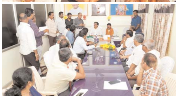
విభాగాల కోచ్ లు, క్రీడాకారులు, కూటమి పార్టీల నాయకులు, పలువురు పట్టణ ప్రముఖులు పాల్గొన్నారు.