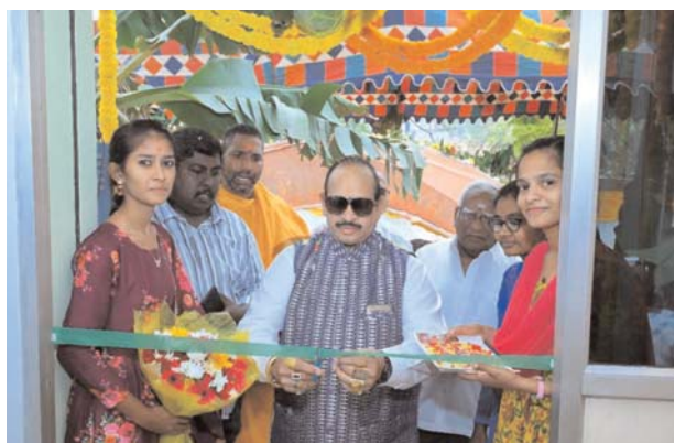
అవకాశాలు కల్పించాలని ఆశీర్వదించారు. ఈ కార్యక్రమంలో దెందులూరు మండలానికి చెందిన పలువురు ప్రముఖులు వ్యాపారవేత్తలు రాజకీయ ప్రముఖులు పాల్గొన్నారు