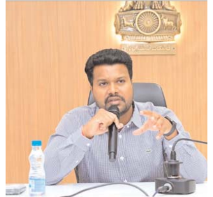
జరిగిందని కలెక్టర్ తెలిపారు. ముందుగా రైతులు ఆరుగంటల శ్రమించి పండించిన పంటను తుఫాను మూలంగా నష్టపోకుండా తగిన చర్యలు ముందుగానే అధికారులు చర్యలు చేపట్టినందుకు అధికారులందరినీ జిల్లా కలెక్టర్ మహేష్ కుమార్ అభినందించారు.

నివారించగలిగామన్నారు. టార్పిన్లు అవసరమైతే రైతులకు పివీసీల ద్వారా రాయితీపై అందించేలా చర్యలు తీసుకోవాలని కలెక్టర్ మహేష్ కుమార్ అధికారుల ఆదేశించారు. ధాన్యం సేకరణ విషయంలో క్షేత్రస్థాయిలో రైతులకు ఏమైనా సమస్యలు ఎదురైతే అమలాపురం కలెక్టరేట్లో ఏర్పాటు చేసిన కంట్రాక్ట్ రూమ్ నెంబర్ 8309432487.9441692275. నంబర్ కు ఫోన్ చేస్తే సంబంధిత సమస్యను వెంటనే పరిష్కరించే దిశగా సర్వేలు చేపడతామన్నారు. జిల్లాలో ఈ ఖరీఫ్ సీజన్లో 2. లక్షల 30 వేల మెట్రిక్ టన్నుల ధాన్యాన్ని లక్ష్యాన్ని నిర్దేశించగా ఇప్పటివరకు 1.18.559. మెట్రిక్ టన్నుల ధాన్యాన్ని సేకరించడం జరిగిందని కోతలు పూర్తయిన 14.417 మెట్రిక్ టన్నుల ధాన్యాన్ని మిల్లులకు షిప్ చేయవలసి ఉందన్నారు ఇప్పటివరకు సేకరించిన ధాన్యాన్ని 252 కోట్ల రూపాయలు రైతులు ఖాతాలో జమ చేయడం