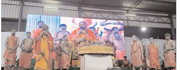
కార్తీకదీపం మహోత్సవం, అన్నదాన కార్యక్రమాన్ని నిర్వహించారు. ఈ కార్యక్రమంలో దేవస్థానం సభ్యులు, భక్తులు, తదితరులు పాల్గొన్నారు.