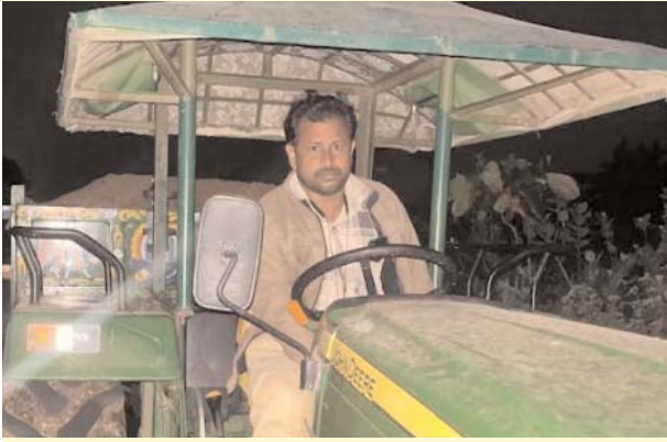
మాడుగుల డిసెంబర్ 13 నవభూమి