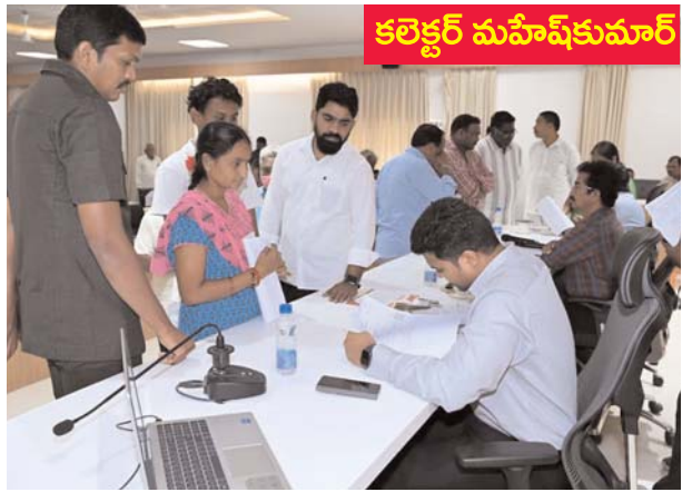
లు . అర్జీదారుల నుండి సుమారుగా 191 అర్జీలను స్వీకరించారు. ఈ సందర్భంగా జిల్లా కలెక్టర్ మాట్లాడుతూ అర్జీదారుల సమస్యల పట్ల సానుకూలంగా స్పందించి పరిష్కార మార్గాలు నాణ్య తతో చూపుతూ రీ ఓపెన్ కు ఆస్కారం లేకుండా అప్రమ త్తంగా వ్యవహరించాల న్నారు. అర్జీదారుల ఫిర్యా దుల పట్ల క్షేత్రస్థాయిలో క్షుణ్ణంగా విచారించి నిబం ధనల మేరకు తగు పరిష్కార మార్గాలు అర్జీదారుడు సంతృప్తి చే %శీ%దే స్థాయిలో పరిష్కార మార్గాలు చూ పాలని ఆదేశించారు. ప్రభుత్వ మూడంచెల విధానంలో సంతృప్తి స్థాయిలను నిరంతరం పర్యవేక్షిస్తుందని కావున ప్రతి అధికారి అర్జీలను క్షేత్రస్థాయిలో పూర్తిగా విచారించి సమస్యకు ఖచ్చితమైన పరిష్కార మార్గాలు చూపాలని ఆయన. ఆదేశించారు