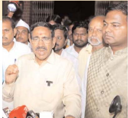
విద్యకు పెద్దపీఠ వేస్తారన్నారు. ఈ కార్యక్రమంలో టీడీపీ నాయకులు,అధికారులు పాల్గొన్నారు.