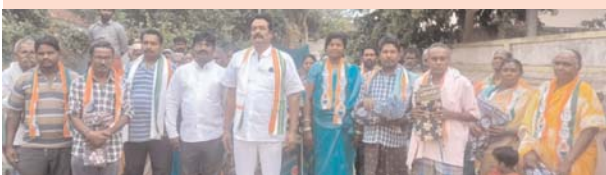
దెందులూరు డిసెంబర్ 17 నవభూమి