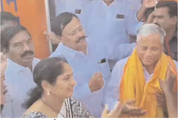
శాఖ మంత్రి సవిత,ఎంపీ పార్లసారథి లు పెనుగొండ నియోజకవర్గం టీడీపీ సీనియర్ నాయకులు కురుబ కృష్ణమూర్తి ప్రశాంతి రైల్వే స్టేషన్ లో కేంద్ర సహాయ మంత్రి సోమన్న కు వీడ్కోలు పలికారు