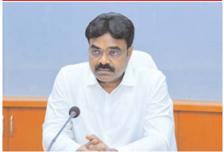
జిల్లా కలెక్టర్ వెంకట మురళి

సుందరీకరించాలన్నారు. నాగార్జునసాగర్, ప్రకాశం బ్యారేజీలోని నీటి నిల్వలపై ఆరా తీశారు. నీటి సరఫరా విషయమై అధికారులను అడిగి తెలుసుకున్నారు. రబీ సీజన్లో, లాభదాయకమైన పంటల సాగుపై రైతులకు అవగాహన కల్పించాలని ఉద్యాన శాఖ అధికారిని ఆదేశించారు. వెదుళ్ళపల్లిలో ఏర్పాటుచేసిన తేనె తయారీ పరిశ్రమ గురించి వివరాలు అడిగి తెలుసుకున్నారు. డిఆర్డిఏ, బిసి, ఎస్సీ సంక్షేమ శాఖలు, ఉద్యానవన శాఖ అధికారులు సమన్వయంతో లంక గ్రామాల్లో కుటీర పరిశ్రమలు ఏర్పాటు చేయాలన్నారు. కారం, పసుపు పొదులు, అరటిపండు చిప్స్, కూరగాయలతో పచ్చళ్ళు తయారు చేయించి ఆ గ్రామాలలోని వారికి ఉపాధి కల్పించాలన్నారు. జిల్లాలోని అన్నా క్యాంపిస్టు సరైన సమయానికి తీయడం లేదనే ఫిర్యాదులు వస్తున్నాయన్నారు. పారిశుధ్య సరిగా లేదని ఐఎఆర్ఎస్ కాల్స్ ద్వారా వచ్చిన ఫిర్యాదులను పరిష్కరించాలన్నారు. ఆ ఫిర్యాదులపై స్పందించారా, సమన్వయం పరిష్కరించారా లేదా అని రేపల్లె బాపట్ల చీరాల అద్దంకి మున్సిపల్ కమిషనర్లను నిలదీశారు. ఈ సమావేశంలో సిపిఓ అధికారి శ్రీనివాస్, 14 శాఖల జిల్లా అధికారులు తదితరులు పాల్గొన్నారు.