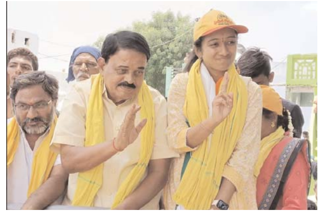
కార్యకర్తలు, మహిళలు నారా లోకేశ్ బాబు కి కొత్తచెరువు మండలం సర్కిల్ నందు ఘనంగా స్వాగతం పలకడానికి పెద్ద ఎత్తున తరలిరావాలని వారు కోరారు.