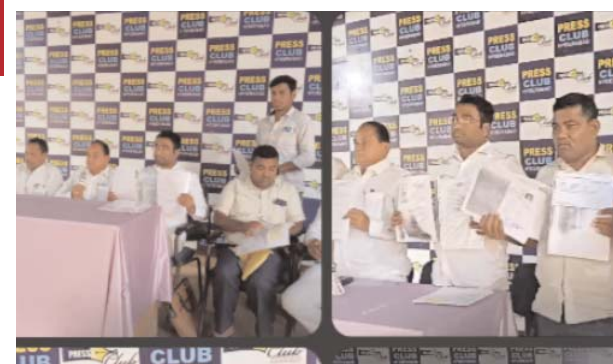
ఇచ్చారని ఆయన ఆరోపించారు మిగిలిన భూమి వాస్తవ్యులైన పద్దదారుల గిరిజనులకు స్థానికులకు ప్రజాప్రతిని వారికి కేటాయించి భూమిని అందజేయాలని ఆయన డిమాండ్ చేశారు