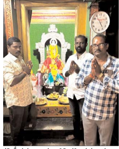
కమిటీ సభ్యులు అమ్మవారిని దర్శించుకున్నారు

సందర్భంగా ఆలయ కమిటీ సభ్యులు మాట్లాడుతూ అమ్మవారి ఉత్సవ సుమూహారాన్ని ఫిబ్రవరి 4వ తేదీన నిర్వహించడం జరిగిందని గాలాయిగూడెం శ్రీ అచ్చమ్మ పేరంటాలమ్మ ఉత్సవాల నిర్వహణ కమిటీ సభ్యులు దెందులూరు మండలం గాలాయిగూడెం గ్రామములో వెలసిన శ్రీ అచ్చమ్మ పేరంటాల తల్లి 68వ వార్షికోత్సవం శ్రీ అచ్చమ్మ పేరంటాల తల్లి ఉత్సవములు ది 04-02-2025నుండి 12-02-2025 వరకు జరుగుతాయని 13-02-2025 తేదీని వేలాదిమందికి మహా అన్న సమాధాన కార్యక్రమం కలదు అని ఉత్సవ కమిటీ వారు తెలియజేశారు. భక్తులు ఎంతమంది వచ్చినా ఇబ్బంది లేకుండా ఇప్పటికే పూర్వ స్థేజిని పురం నిర్మాణం చేయడం జరిగిందని కమిటీ సభ్యులు తెలిపారు. ఈ కార్యక్రమంలో గాలాయిగూడెం గ్రామ శ్రీ అచ్చమ్మ పేరంటాలమ్మ తల్లి ఉత్సవ మరియు ఆలయ