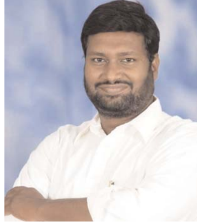
నిలుస్తుంది,” అని తెలిపారు.

అభిప్రాయపడ్డారు. మూడో రాకెట్ ప్రయోగ కేంద్రం ఏర్పాటుకు రూ. 3984.86 కోట్ల వ్యయంతో మౌలిక సదుపాయాల అభివృద్ధి చేపట్టడంపై కేంద్ర ప్రభుత్వానికి కృతజ్ఞతలు తెలియజేశారు.” ఈ ప్రాజెక్టు ద్వారా భారత్ అంతరిక్ష రంగంలో మరిన్ని విజయాలు సాధించి, ప్రపంచస్థాయి శక్తిగా గుర్తింపు పొందుతుందన్నారు. 2035 నాటికి భారతీయ అంతరిక్ష కేంద్రం స్థాపన, 2040 నాటికి చంద్రుడిపై భారత వ్యోమగాముల బృందం దిగిపడే లక్ష్యాలను సాధించేందుకు ఈ నిర్ణయం కీలకంగా మారుతుందని విశ్వాసం వ్యక్తం చేశారు. “భవిష్యత్లో భారత అంతరిక్ష రంగం మరిన్ని విజయాలను సాధించి, ప్రపంచంలోని అగ్రగామిగా