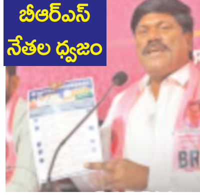
బీఆర్ఎస్ నేతల ధ్వజం

- 11 గ్రామాల్లో 5 వేల మందికి జాబ్ కార్డ్ ఉన్నాయి. భూమి లేని వారు 780 కుటుంబాలు, 20 రోజుల పనిదినాలు పూర్తి చేసిన వారి సంఖ్య 331 గా ఉంది. దీని ప్రకారం భూమి లేకుండా, జాబ్ కార్డ్ కలిగి ఉండి, 20 రోజుల పనిదినాలు పూర్తి చేసిన వారి శాతం 5.6%