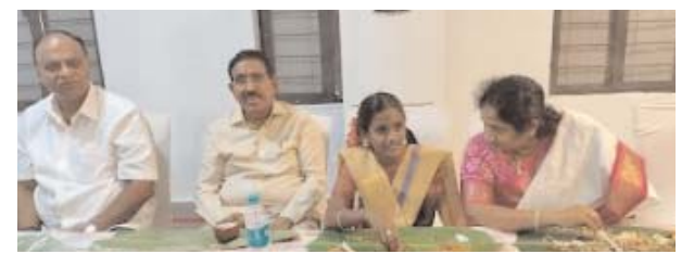
నియోజకవర్గస్థాయి అధికారులు ప్రజాప్రతినిధులు నాయకులను ఉపాధ్యాయులు విద్యార్థులు వారైన్లు పాల్గొన్నారు.