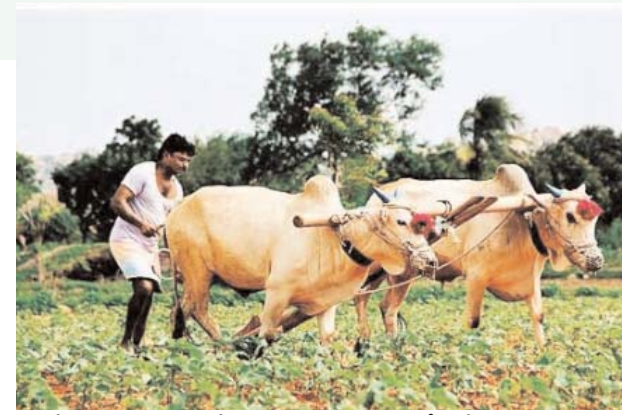
పనిలో ఉన్నారు. అప్పట్లో రైతు రుణాలు , మామీ చేస్తామంటూ ఓట్లు వేయించుకొని నిలువునా ముంచారని ఇప్పుడు అదే బాటలో నడుస్తున్నారని ప్రజలు రైతులు వాపోతున్నారు

కాశీనాయన ఫిబ్రవరి 23 (నవభూమి) 2024సంవత్సరం లో ఎన్నికల ప్రచారంలో కూటమి ప్రభుత్వం అధికారంలోకి వస్తే ప్రతి ఒక రైతుకు పెట్టుబడి సాయం రూ 20 వేలు అందిస్తామని హామీ ఇచ్చి హామీని చంద్ర బాబు సర్కార్ అటకెక్కించేశారు. అధికార పగ్గాలు చేపట్టక తరువాత మాట మార్చేశారు. పిఎం కిసాన్ పథకం కింద కేంద్ర ప్రభుత్వం ఇచ్చే సాయంతో కలిపి పెట్టుబడి సాయం అందిస్తాము చెప్పారు. పిఎం కిసాన్ కింద ఇప్పటికే కేంద్ర ప్రభుత్వము రెండు విడతలుగా సాయం అందజేసింది. చంద్ర బాబు సర్కార్ పైసా ఇవ్వలేదు. కేంద్రం మూడవ విడత పిఎం కిసాన్ సాయం నేడు విడుదల చేయనుంది . అయినా రాష్ట్ర ప్రభుత్వం అన్నదాత సుఖీభవ సాయం అందించే దిశగా ఒక అడుగు కూడా వేయలేదు. మిగిలిన పథకాల మాదిరిగానే ఈ పథకాన్ని కూడా ఈ ఏడాది పూర్తిగా ఎగ్గడితే మేలన్న ఆలోచనలో ప్రభుత్వము ఉన్నట్లు తాజా పరిణామాలు చెబుతున్నాయి. 2014 సంవత్సరంలో అధికారంలోకి వచ్చాక హామీలు అమలు చేయకుండా రైతులు సహా అన్ని వర్గాల ప్రజలను నిలుపునా వంచించినా చంద్ర బాబు ఇప్పుడు ఇదే