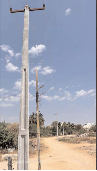
ఎమ్మెల్యే ద్వారా సమస్యలు ఏ విధంగా పరిష్కారం అవుతున్నాయో చెప్పేందుకు ఈ సంఘటనే ఉదాహరణ అని అన్నారు.

విద్యుత్ శాఖ ఎన్.ఈ.తో ఫోన్ లో మాట్లాడారు. కాలనీలో ప్రజలు ఇబ్బందులు పడుతున్నారని వెంటనే లైన్లు మార్చాలని చెప్పారు. ఎమ్మెల్యే ఆదేశాలతో విద్యుత్ శాఖ సిబ్బంది రెండు రోజుల నుంచి ఇక్కడ లైనింగ్ పనులు చేపట్టారు. ప్రస్తుతం ఉన్న 100కి కెపాసిటీ ట్రాన్స్మార్టర్ల స్థానంలో 160కి.వి కెపాసిటీ ట్రాన్స్మార్టర్లను ఏర్పాటు చేస్తున్నారు. విద్యుత్ సౌకర్యం లేని కాలనీ కొత్త లైనింగ్ లాగారు. అంతే కాకుండా పంచాయతీకి పాత ట్రాన్స్ ఫార్మర్ల స్థానంలో నూతనంగా 12 ట్రాన్స్ ఫార్మర్ల మంజూరు చేశారు. అలాగే వేసవిని దృష్టిలో ఉంచుకొని విద్యుత్ సమస్యలు రాకుండా చర్యలు తీసుకోవాలని ఎమ్మెల్యే దగ్గుపాటి ఆదేశించారు. ఎమ్మెల్యే తమ కాలనీకి వచ్చిన సమయంలో సమస్యను చెప్పామని అయితే ఇంత వేగంగా స్పందిస్తారని అనుకోలేదని స్థానికులు అన్నారు. ఎమ్మెల్యే దగ్గుపాటి మాటల మనిషి కాదని చేతల మనిషి అని అన్నారు. స్థానిక టిడిపీ నాయకులు మాట్లాడుతూ మీ ఇంటికి -మీ