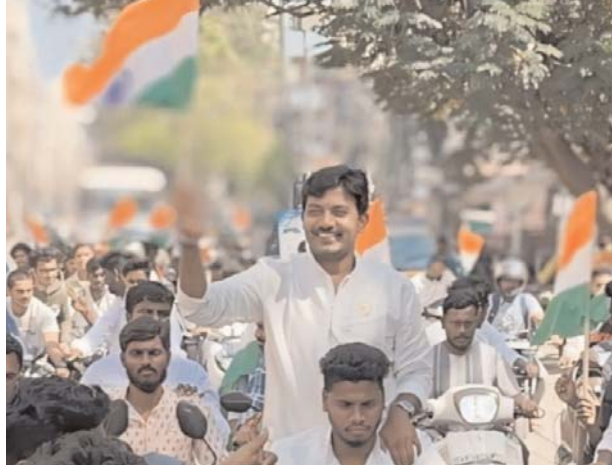
కడుతున్నారు. త్వరలో పూర్తిస్థాయి కాషాయ భారత్ గా అవతరించబోతుందన్నారు.