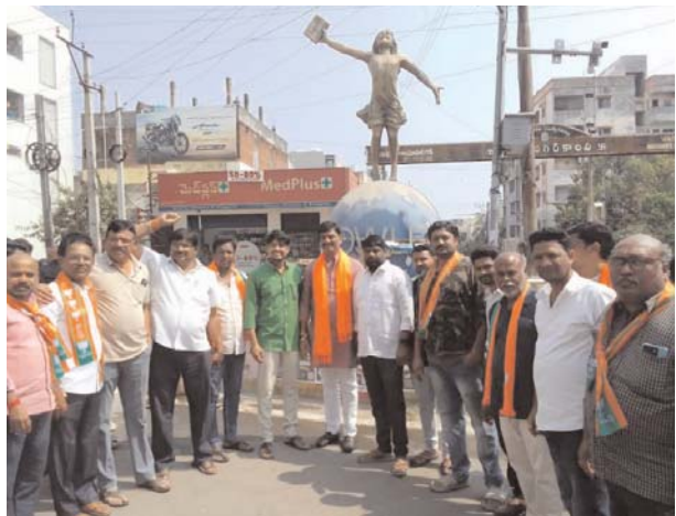
కోరుకున్నారు అని తెలియజేశారు