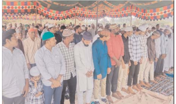
ఎలాంటి అవాంఛనీయా సంఘటనలు జరుగకుండా తమ సిబ్బందితో బందోబస్తు నిర్వహించారు.