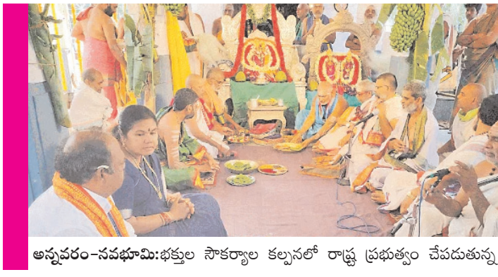
అన్నవరం-నవభూమి:భక్తుల సౌకర్యాల కల్పనలో రాష్ట్ర ప్రభుత్వం చేపడుతున్న...

స్టాన్ చేయడం విశేషం. మొత్తం 6682 మంది భక్తులు ఈ నెలలో స్టాన్ చేయగా వవీఆర్ఎస్ కార్పొరేషన్లో 3284 మంది స్పందించి వివరాలు తెలియజేశారు.