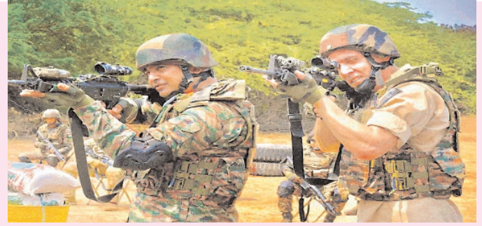
విన్యాసాలు నిర్వహించేందుకు ఏర్పాటు చేసుకున్నారు.

త్రివిధ దళాలు ఇప్పు టీకే సూర్యారావుపేట బీచ్కు చేరుకున్నాయి. అమెరికాకు చెందిన 2 యుద్ధ నౌకలు, భారతకు చెందిన యుద్ధ నౌక ల ఇప్పుటికే కాకినాడ సముద్ర ప్రాదేశిక డీప్ సీలో ఉన్నాయి. హూవర్ క్రాఫ్టలు, సహాయ కార్యక్రమాలకు వినియోగం చే పలు వాహనాలు, యుద్ధ ట్యాంకర్లు, యుద్ధ నౌకలు డీప్ సీలు ఉన్నాయి. ఆర్మీ సిబ్బంది సముద్ర తీరంలో ప్రత్యేక రక్షణ గుదారాలు ఏర్పాటు చేసుకున్నారు. టైగర్ ట్రంప్ యూ పీబీయూస్ విన్యాసాలు మంగళవారం నుంచి ఈనెల 13 వరకు జరుగుతాయని త్రివిధ దళాల అధికారులు తెలిపారు. ఇరుదేశాల త్రివిధ దళాల సేనలు బుధవారం నుంచి సముద్రం, ఆకాశంలో