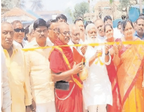
అన్నవరం-నవభూమి:భక్తుల సౌకర్యాల కల్పనలో రాష్ట్ర ప్రభుత్వం చేపడుతున్న...

గోకవరం, ఏప్రిల్ 8(ఆంధ్రజ్యోతి): గ్రామాల ప్రగతే లక్ష్యంగా ప్రభుత్వం పనిచేస్తోందని జగ్గం పేట ఎమ్మెల్యే జ్యోతుల నెహ్రూ అన్నారు. పల్లె పంచాయతీ కార్యక్రమంలో భాగంగా మండలంలోని కామరాజుపేట, కొత్తపల్లి, గోకవరం, తిరుమల యాపాలెం, మల్లవరం గ్రామాల్లో సమావేశం రూ. 1.65 కోట్ల వ్యయంతో నిర్వహించిన సిఎంబీ రోడ్లను మంగళవారం ఆయన ప్రారంభించారు.