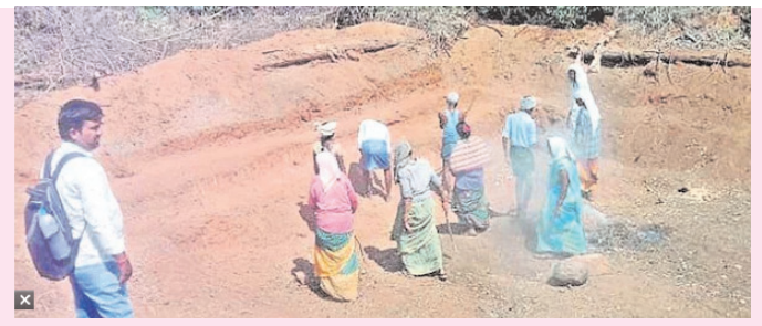
పనులు ఏర్పాటు చేయాలని, పనులు కల్పించాలని ఫీల్డ్ అనిస్టెంట్ చుట్టూ ఎన్ని సార్లు తిరిగినా పట్టించుకోవడంలేదని కూలీలు ఆవేదన వ్యక్తం చేస్తున్నారు.

నార్సల-నవభూమి : పలన కూలీల నివారణ కోసం దేశంలోనే మొట్టమొదటి సారిగా నార్సల మండలం బండ్లపల్లిలో ఉపాధి హామీ పథకాన్ని ప్రారంభించారు. అయితే అధికారులు ఉపాధి పనులు కల్పించకపోవడంతో, పనులు కోసం కూలీలు ఎదురు చూడాలిస్తూ పరిస్థితి ఈ మండలంలోనే నెలకొంది. నార్సల మండల వ్యాప్తంగా ఉపాధి హామీ పథకానికి సంబంధించి 12వేల జాబ్ కార్డులు ఉన్నాయి. వర్షపు నీటి నిల్వ కోసం రాతి కట్టడం, వంకల్లో పూడిక తీత పనులు, కొండ దిగువ, ఎగువన క్రొవ ఏర్పాటు తదితర ఉపాధి ద్వారా చేపట్టాల్సిన ఎన్నో పనులు ఉన్నాయి. నెల రోజులుగా అధికారులు ఫాం పొండ్ల పనులు మాత్రమే నిర్వహిస్తున్నారు. దీంతో మండల వ్యాప్తంగా రెండు వేల మందికి మించి ఉపాధి కూలీలకు పనులకు వెళ్లడంలేదు. ఉపాధి ద్వారా చేపట్టాల్సిన అన్ని పనులు ఏర్పాటు చేస్తే దాదాపు ఆరు వేల మందికి పైగా పనులకు వెళ్లేవారు. ఇదిలాఉండగా ప్రస్తుతం ఏడాదికాలం అయినందున ఫాం పొండ్ల పనులు చేయాలంటే, మట్టి ఎంత తవ్వినా రావడంలేదని కూలీలు వాపోతున్నారు. చేతులు బొజ్జలు పోతున్నాయని ఆవేదన వ్యక్తం చేస్తున్నారు. నార్సల మేజరు పంచాయతీ పరిస్థితికి వస్తే... పనులకు వెళ్లాలిస్తే దాదాపు వేయి మంది కూలీలు ఉన్నారు. 70 మంది మాత్రమే ఫాంపొండ్ల తవ్వకాలకు వెళ్తున్నారని అధికారులు తెలిపారు. అన్ని